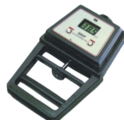
デジタル握力計 T. K. K. 1857