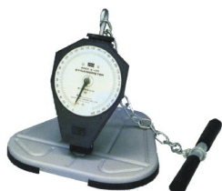
背筋力計 T. K. K. 1204