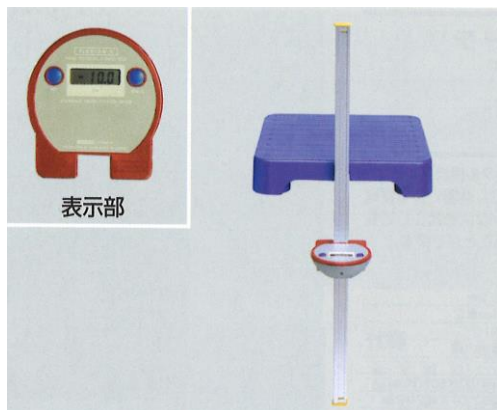
旧フレクションD (T. K. K. 5103)