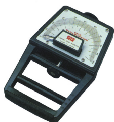
握力計 T. K. K. 1201