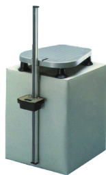
デジタル前屈計 T. K. K. 1859